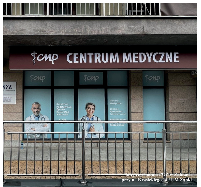
Fot. przychodnia POZ w Ząbkach przy ul. Krasickiego 14 / UM Ząbki