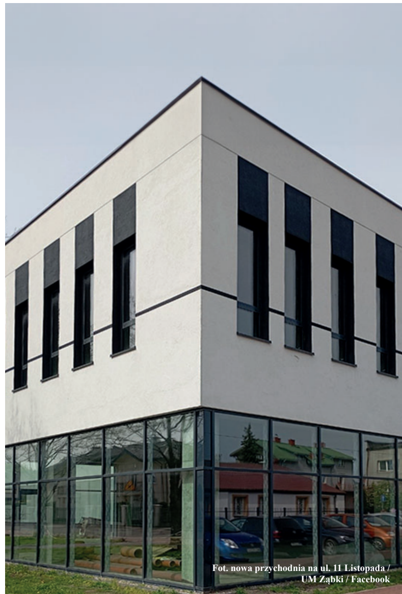
Fot. nowa przychodnia na ul. 11 Listopada

Materiał powstał we współpracy z Urzędem Miasta w Ząbkach