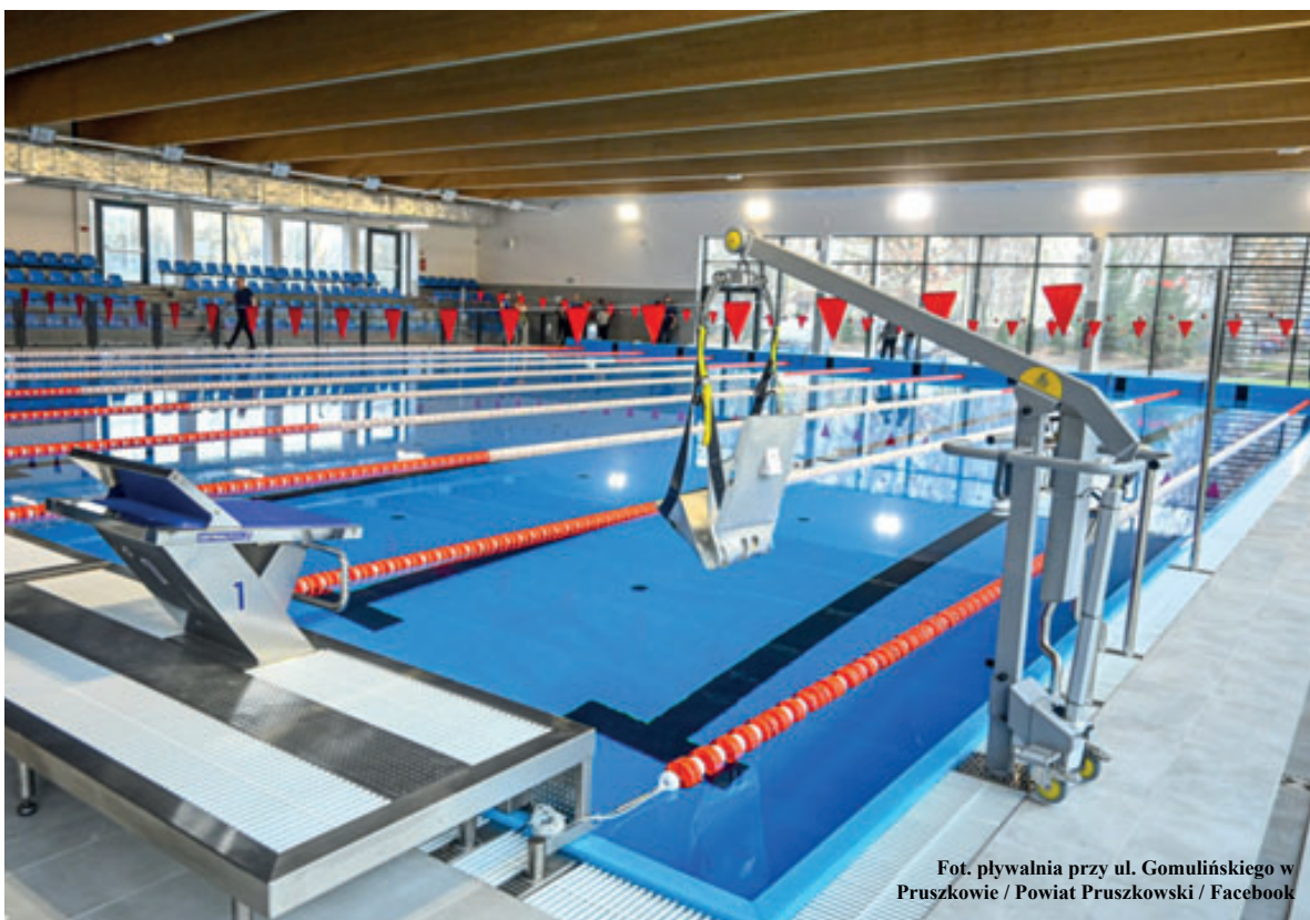
pływalnia przy ul. Gomulińskiego w Pruszkowie