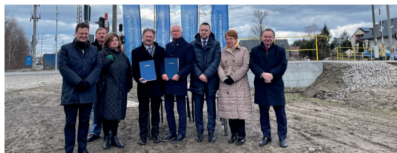
Sródmieście ok. 28 minut”.

Podróżni korzystający z nowego przystanku kolejowego zyskają możliwość sprawnego dojazdu m.in. do Warszawy. Jak informują w komunikacie PKP Polskie Linie Kolejowe S.A.: „Do przystanku Warszawa Stadion będzie można dojechać w około 23 minuty, a na Warszawę