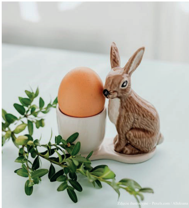
Zdjęcie ilustracyjne – Pexels.com / Alleksana

Do tradycyjnych, wielkanocnych potraw można zaliczyć: żurek, zupę chrzanową, jajka faszerowane, gotowaną białą kielbasę, domowy pasztet, sałatkę jarzynową, babkę drożdżową, makowiec, sernik, mazurek.