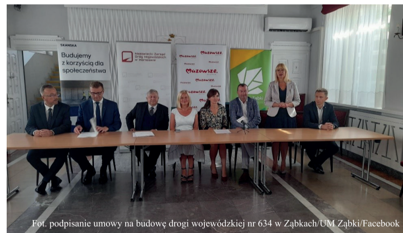
Fot. podpisanie umowy na budowę drogi wojewódzkiej nr 634 w Ząbkach/UM Ząbki/Facebook

Więcej na www.bip.zabki.pl , w zakładce: Oferty pracy.