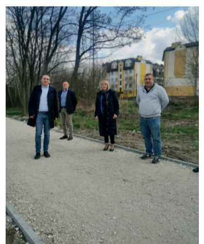
Material powstał we współpracy z Urzędem Miasta Ząbki