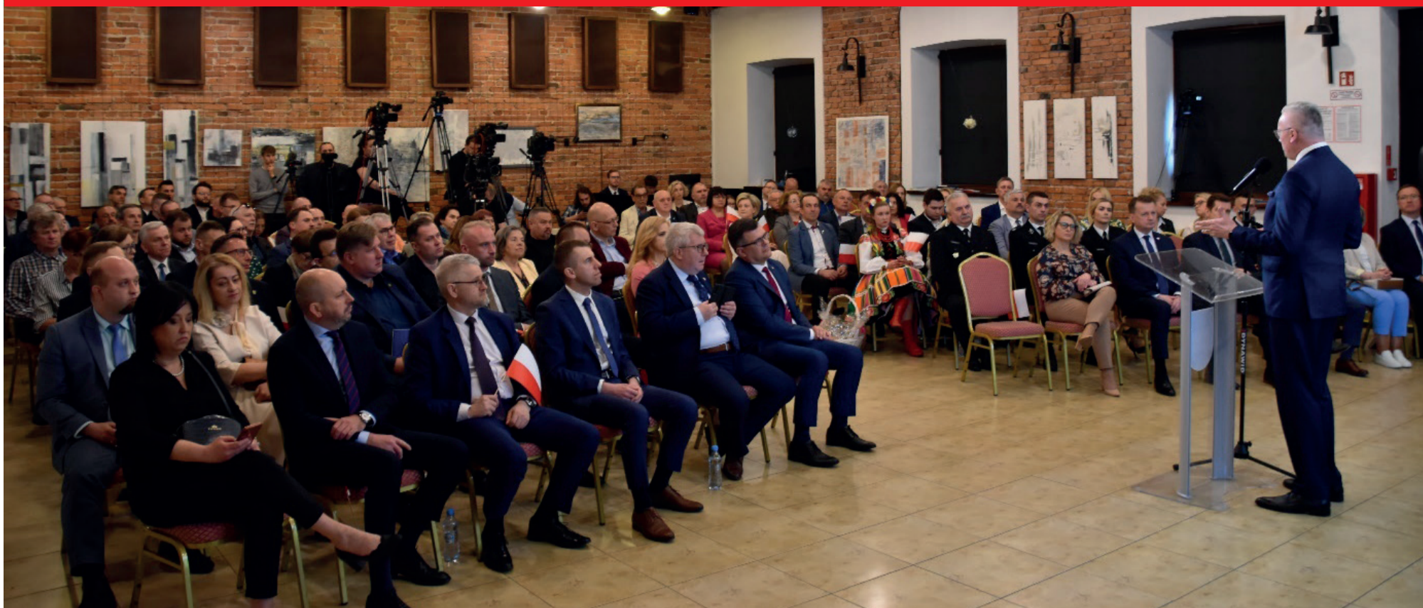
Fot. Starostwo Powiatowe w Wołominie