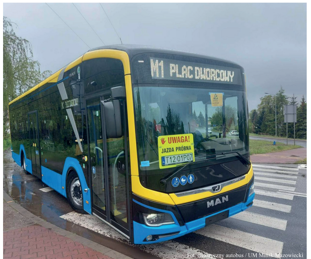
Fot. elektryczny autobus / UM Mińsk Mazowiecki