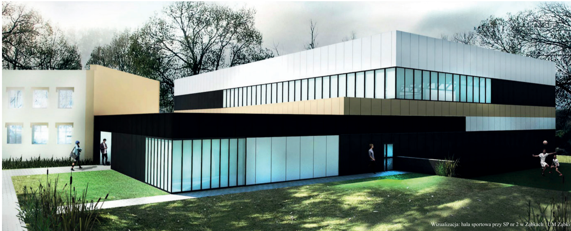
Wizualizacja: hala sportowa przy SP nr 2 w Ząbkach

W Ząbkach trwają prace związane z budową hal sportowych, zlokalizowanych przy szkołach podstawowych. Nowy obiekt, na którym już jest wykonywana elewacja, powstaje przy Szkole Podstawowej nr 1. Na bardziej zaawansowanym etapie realizacji jest hala sportowa, zlokalizowana przy Szkole Podstawowej nr 2, która zostanie oddana do użytku na początku nowego roku szkolnego.