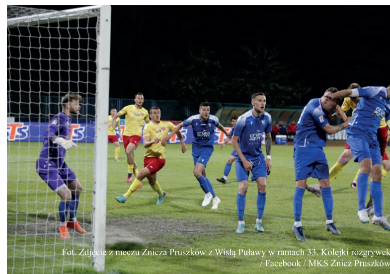
Fot. Zdjęcie z meczu Znicza Pruszków z Wisłą Puławy w ramach 33. Kolejki rozgrywek / Facebook / MKS Znicz Pruszków

(ostatniej) kolejki sezonu 2022/2023 II ligi, rozegranym na wyjeździe z Hutnikiem Kraków. W spotkaniu,