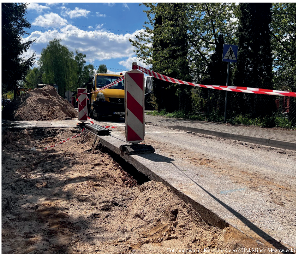
Fot. budowa ul. Kusocińskiego / UM Mińsk Mazowiecki

Źródło: materiały prasowe UM Mińsk Mazowiecki