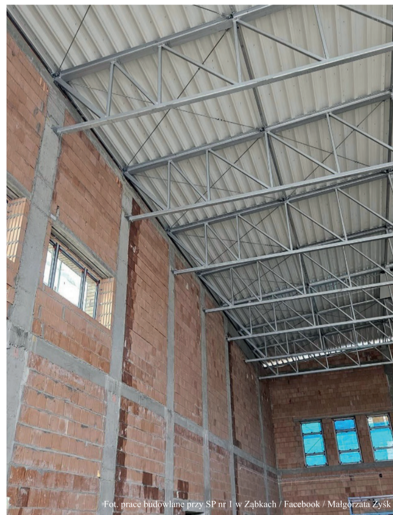
prace budowlane przy SP nr 1 w Ząbkach

Władze Ząbek zapowiadają, że uczniowie Szkoły Podstawowej nr 2 już od nowego roku szkolnego dostaną do dyspozycji nowoczesną i wielofunkcyjną halę sportową.