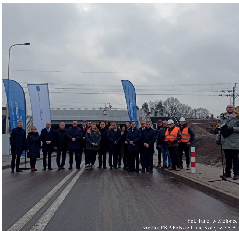
Fot. Tunel w Zielonce

23 grudnia w Zielonce został otwarty drugi tunel drogowy pod torami kolejowymi. Nowa przeprawa pod linią kolejową Warszawa – Białystok ma 100 m długości. Powstał też wiadukt drogowy, łączący ul. Leśną z ul. Słowackiego. Inwestycja, usprawniająca komunikację w mieście, została w całości zrealizowana przez PKP.