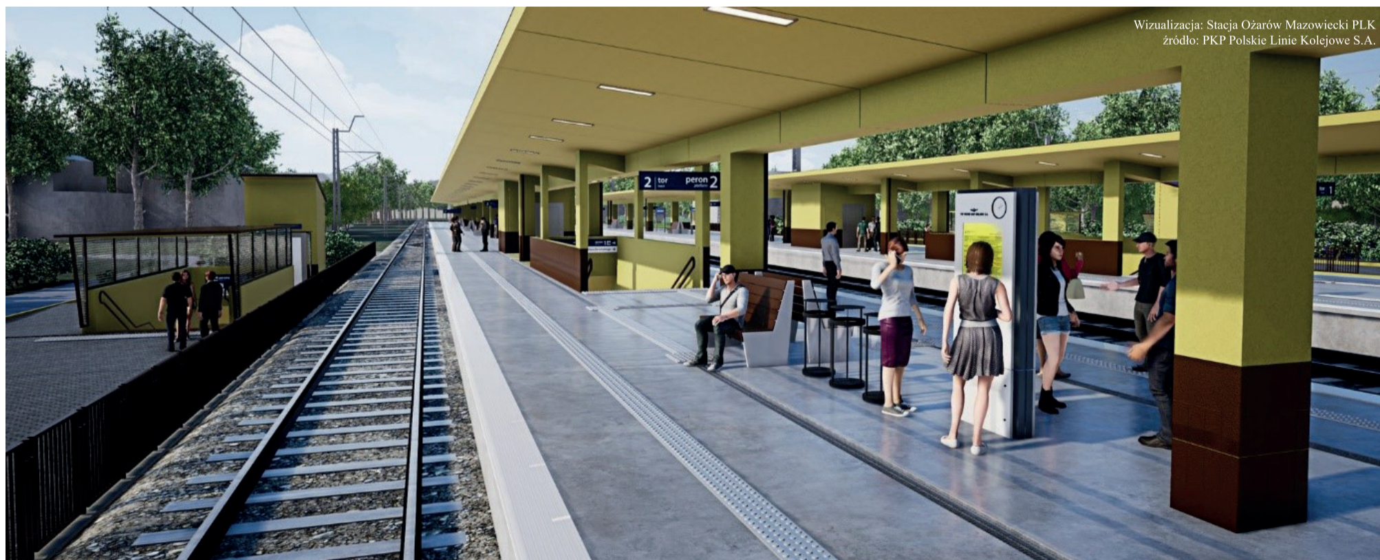
Wizualizacja: Stacja Ożarów Mazowiecki PLK